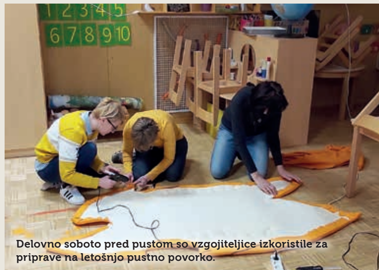
Delovno soboto pred pustom so vzgojiteljice izkoristile za priprave na letošnjo pustno povorko.

V letne delovne programe vrtcev je vključeno tudi seznanjanje otrok z ljudskimi običaji; mednje vsekakor sodi eden izmed najstarejših – pust. Strokovni delavci Vrtca Postojna zvesto sledijo programu in vsako leto posvetijo tudi temu običaju nekaj časa.