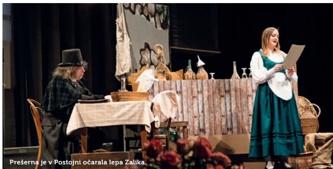
Prešerna je v Postojni očarala lepa Zalika.