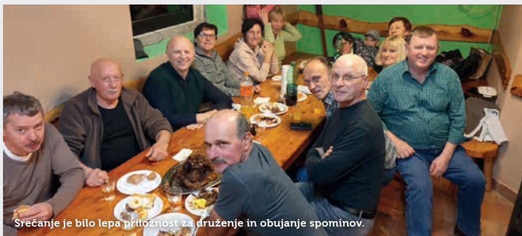
Srečanje je bilo lepa priložnost za druženje in obujanje spominov.

Kot sami povedo, jih je bilo več deset, konj pa en sam. Začetki niso bili lahki. Najprej so najeli prostor, staro žrebčarno na Prestranku – zapuščeno in v slabem stanju. Imela pa je (in še ima) lepo zgodovino in povezavo z Lipico. Kasneje so uspeli prostor kupiti in so gospodarsko poslopje obnovili z lastnimi sredstvi in donacijami, najbolj pomembno pa je, da so mu vdahnili srce in dušo. Na srečanju so obujali spomine in delili izku-