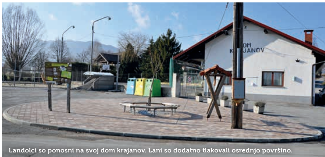
Landolci so ponosni na svoj dom krajanov. Lani so dodatno tlakovali osrednjo površino.

Landol je izrazito prehodna vas in nobenemu domačinu ni vseeno, kakšen vtis odnesejo obiskovalci o njej. Že zaradi Predjamskega gradu se vztrajno povečuje obisk turistov. Odkar posluje v samem centru penzion Lipizzaner Lodge, je tudi pohodnikov in kolesarjev občutno več. Prevladujejo tuji turisti, ki se pridejo sproščat v naročje neokrnjene narave. Pred petimi leti so s pomočjo evropskih sredstev obnovili vaški vodnjak ob kapelici, kjer so se v daljni preteklosti odžejali marsikateri popotniki ob stari rimski cesti. Še en vodnjak oziroma napajalno korito stoji ob cesti pred Kovačevo hišo. Za zdaj so ga le na novo zabetonirali, načrtovana sta še kamnita obloga in tlakovanje talne površine. Propadajoča Deklevova hiša (prvič omenjena kot mitnica leta