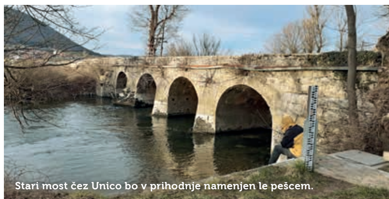
Stari most čez Unico bo v prihodnje namenjen le pešcem.