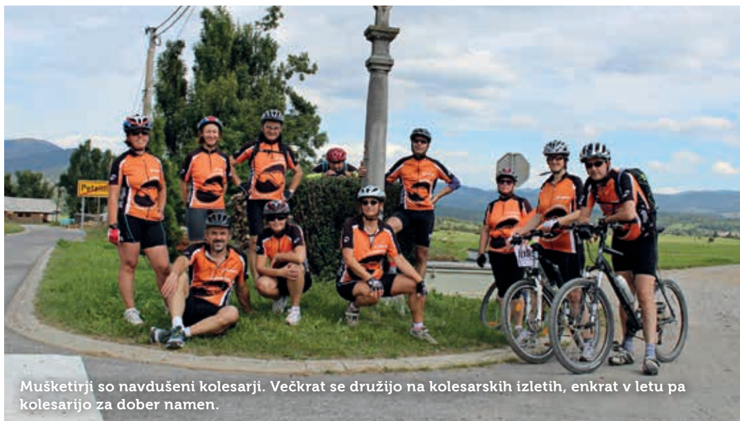
Mušketirji so navdušeni kolesarji. Večkrat se družijo na kolesarskih izletih, enkrat v letu pa kolesarijo za dober namen.