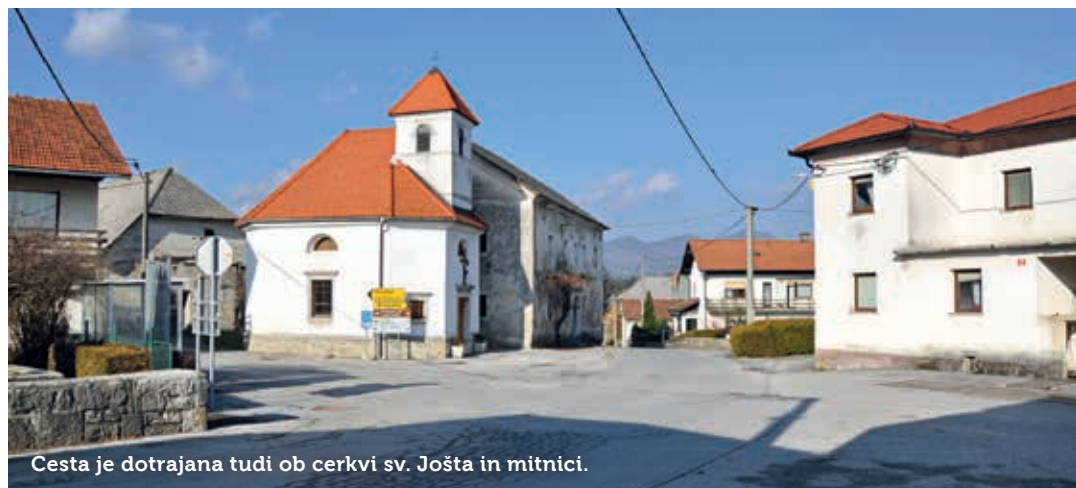
Cesta je dotrajana tudi ob cerkvi sv. Jošta in mitnici.