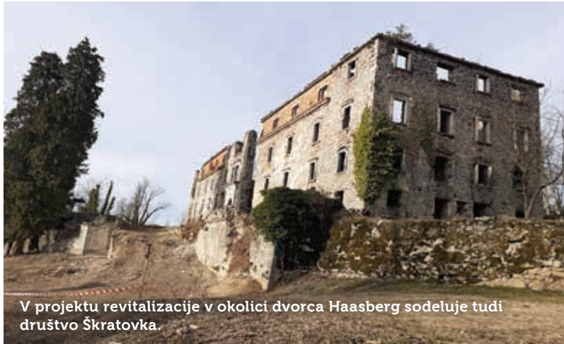
V projektu revitalizacije v okolici dvorca Haasberg sodeluje tudi društvo Škratovka.

ostanek bo prispeval Evropski sklad za regionalni razvoj.