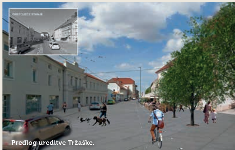
Predlog ureditve Tržaške.

Na Občini so že pred časom jasno povedali, da popolne zapore kljub želji nekaterih (stanovalcev) ne bo, bistveno pa bodo omejili stacionarni promet. Kot pričakuje župan, bodo z novim režimom nekateri bolj, drugi manj zadovoljni, podoba mestnega središča pa bo zagotovo lepša in predvsem pešcem prijaznejša. »Ureditev bo enonivojska, z ravno površino brez pločnikov in z vizualnimi oznakami. Motorni promet bo tekel še naprej enosmerno, kolesarji bodo lahko vozili v obe smeri. Število parkiršč pa bo bistveno manjše,«