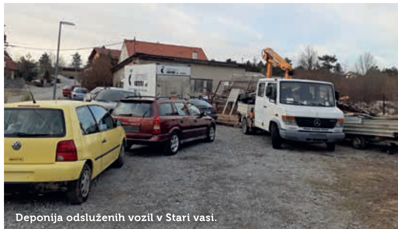
Deponija odsluženi vozil v Stari vasi.