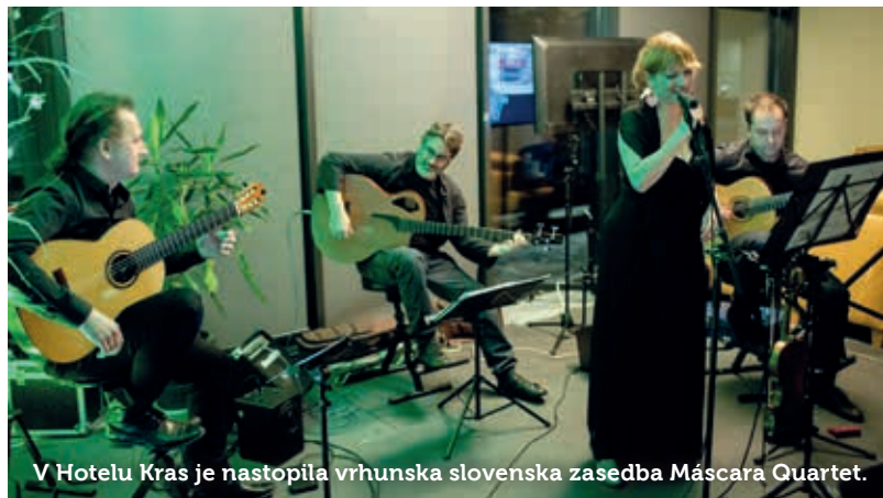
V Hotelu Kras je nastopila vrhunska slovenska zasedba Máscara Quartet.