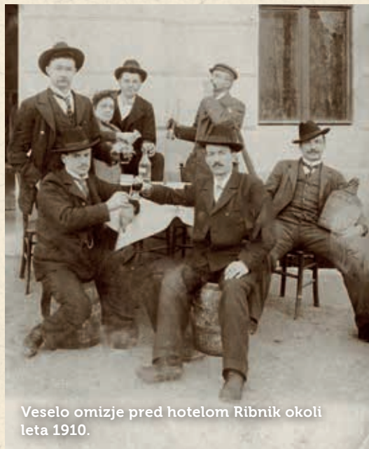
Veselo omizje pred hotelom Ribnik okoli leta 1910.

Januarja lani, ko smo v uredništvu Postojnskega prepaha sklenili, da na zadnji strani časopisa ponudimo bralcem nove vsebine, povezane s preteklostjo naših krajev in ljudi, ste nam bralci stopili naproti. Z vašo pomočjo smo objavili že marsikatero zanimivo fotografijo in z njo povezano zgodbo. Tako bo tudi tokrat.