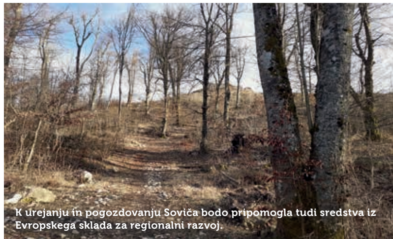
K urejanju in pogozdovanju Soviča bodo pripomogla tudi sredstva iz Evropskega sklada za regionalni razvoj.

Ukrepe za izboljšanje stanja in revitalizacijo kulturne krajine bodo izvajali na 40 hektarjih površine. Občina Postojna je že odkupila dobrih 25 hektarjev kmetijskih zemljišč na osrednjem delu Planinskega polja za izboljšanje stanja ohranjenosti travnikov s prevladujočo stožko ter bazična nizka barja z vrstama kosca in pisane penice, da bodo vzdrževali primerno kmetijsko rabo za ohranjanje omenjenih vrst. Z lastniki zemljišč, ki teh niso želeli prodati, pa