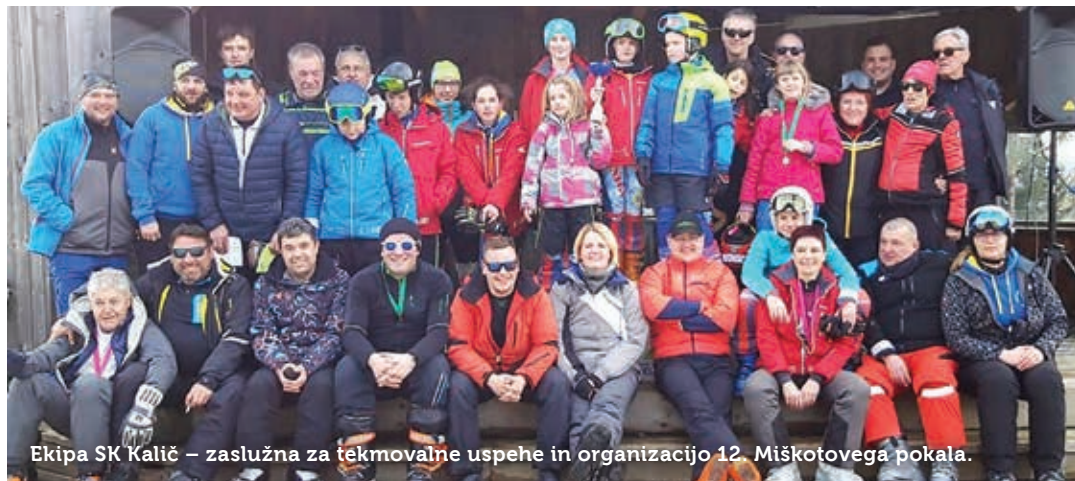
Ekipa SK Kalič – zaslužna za tekmovalne uspehe in organizacijo 12. Miškotovega pokala.