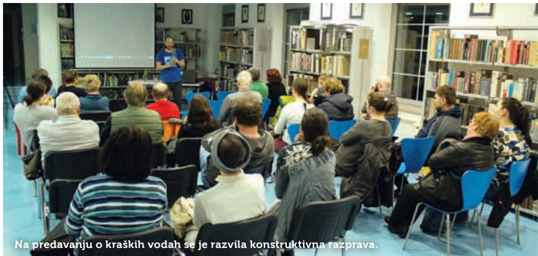
Na predavanju o kraških vodah se je razvila konstruktivna razprava.

Izredno kritičen je do monitoringa oziroma spremljanja stanja voda. »Načeloma imamo za velike slovenske reke nekajkrat letno meritve kakovosti vode, nato so te razvrščene po stopnjah. Za naše