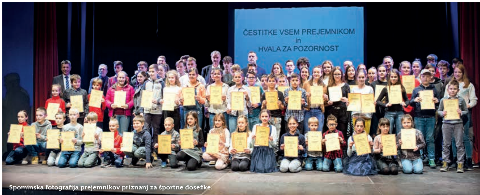
Spominska fotografija prejemnikov priznanj za športne dosežke.