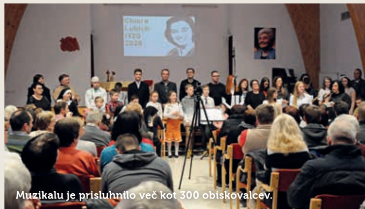
Muzikalu je prisluhnilo več kot 300 obiskovalcev.

Letos mineva sto let od rojstva Chiare Lubich, ustanoviteljice medverskega etičnega gibanja ogniščarjev, znanega tudi pod imenom Marijino delo. V temeljih je to povezano s katoliško cerkvijo, hkrati pa tudi z drugimi religijami in celo s skupinami ateistov. Gibanje temelji na načelu univerzalnega bratstva in povezovanju vseh ljudi. V 182 državah širom sveta ima več kot dva milijona privrženec. V Sloveniji segajo začetki skupnosti Marijinega dela v leto 1966. Za somišljenike gibanja deluje od leta 2002 v Planini Center Mariapoli, občasni dom za duhovno poglobljanje.